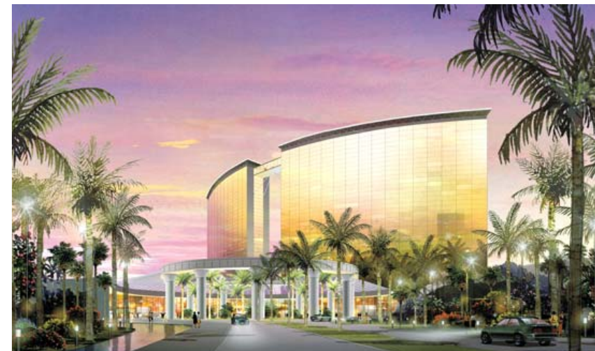
完成予想図(エントランスビュー)