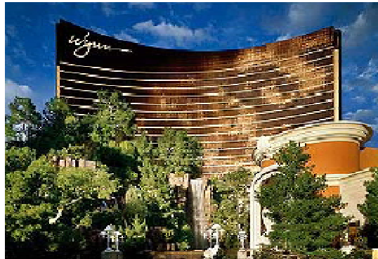
ウイン・ラスベガス