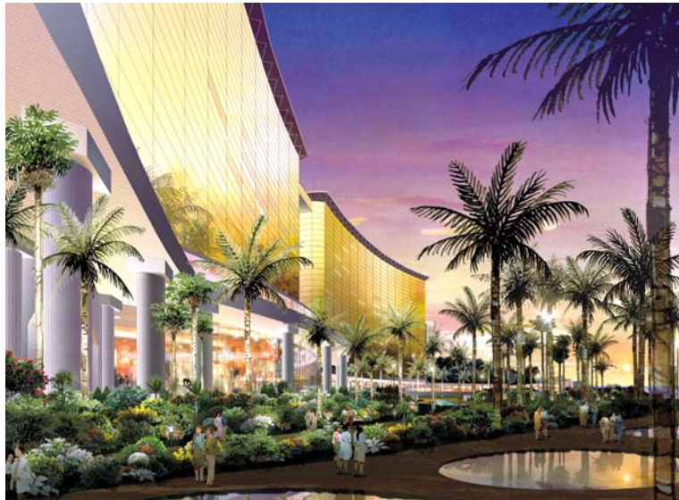
完成予想図(ガーデンビュー)