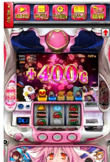
マジカ☆クエスト ゲーム数上乘せ画面