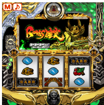
▼ボーナス確定画面