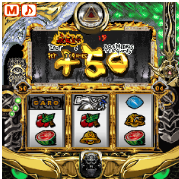
▼疾走モード中画面